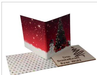
Unter dem Weihnachtsbaum