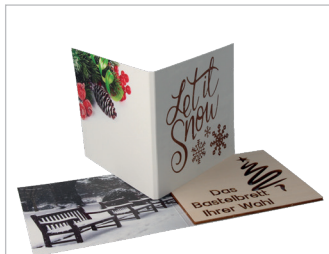
Let it Snow