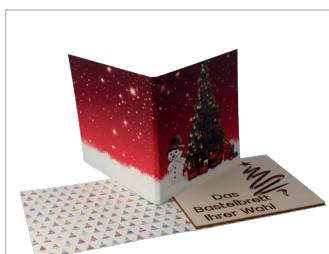
Unter dem Weihnachtsbaum