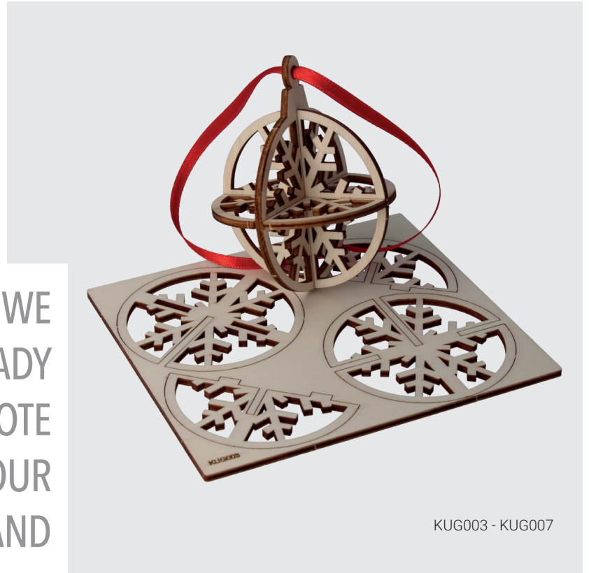
KUG003 - KUG007